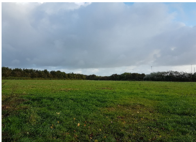
Billedbilag a: Skolens område