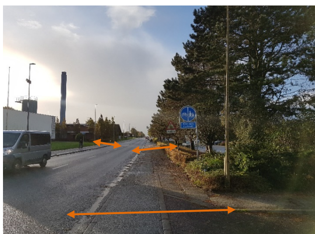
Billedbilag c: Lerpøtvej