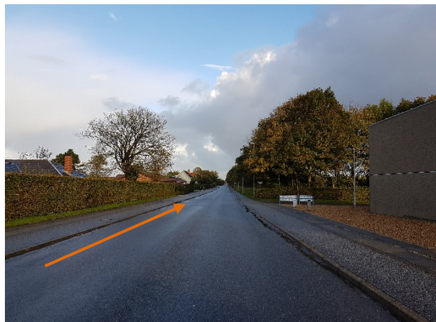
Billedbilag b: Ortenvej