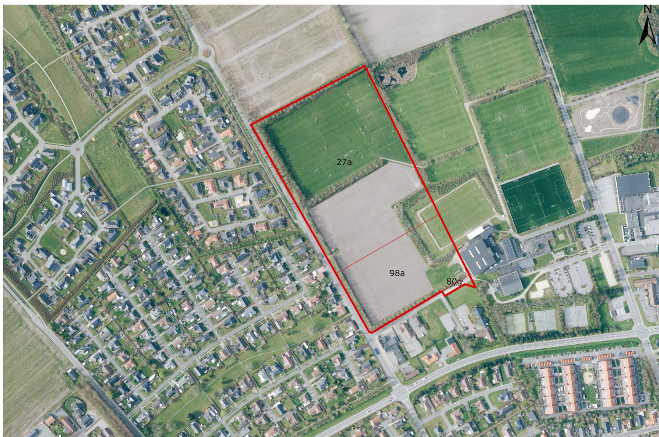
Lokalplanområde (Se billedfigur a, side 4)

Mod øst er beliggende Fritidscentret, svømmehal og Lerpøtvej og mod vest er beliggende et større boligområde. Området er mod 3 sider afgrænset af træbælte bestående af fortrinsvis større ege-, navr og bøgetræer. Mod øst er udsigt til boldbaner, som dog lokalt er afgrænset med beplantet jordvold mod IFV idrætsanlæg.